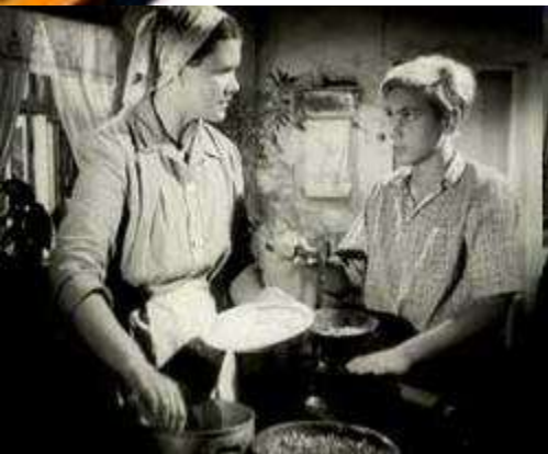
Кадр из фильма «Орлёнок»