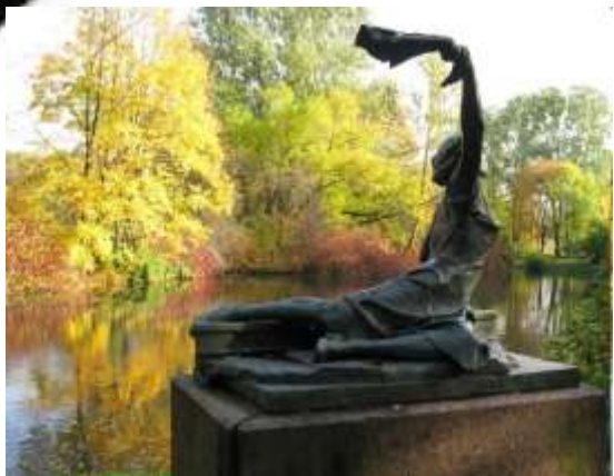
Памятник З. Портновой в Витебске