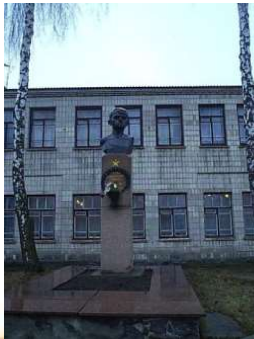
Улица В. Котика в Шепетовке