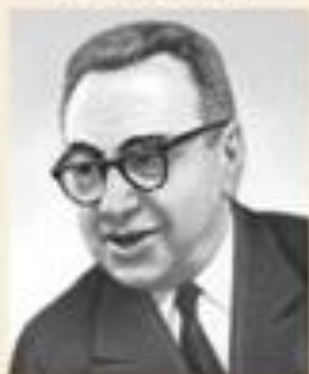
Матвей Исаакович Блантер